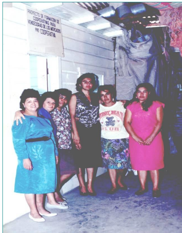
Primera Oficina y Socias Fundadoras de COMIXMUL Mercado San Pablo Siguatepeque

La Cooperativa Mixta Mujeres Unidas Limitada (COMIXMUL) nace en el año 1986 como un proyecto de créditos solidarios entre un grupo de 12 mujeres vendedoras de frutas, verduras y achinerías del mercado San Pablo de la Ciudad de Siguatepeque, y fue hasta el 12 de agosto de 1991, que obtuvimos nuestra Personalidad Jurídica. Con número 768 del Registro Nacional de Cooperativas y nuestra Oficina Central está en la ciudad de Siguatepeque, Departamento de Comayagua. Nuestras actividades principales son el ahorro, préstamo y capacitación para las afiliadas.